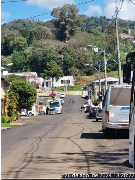
Figura 09 – Rua São Francisco