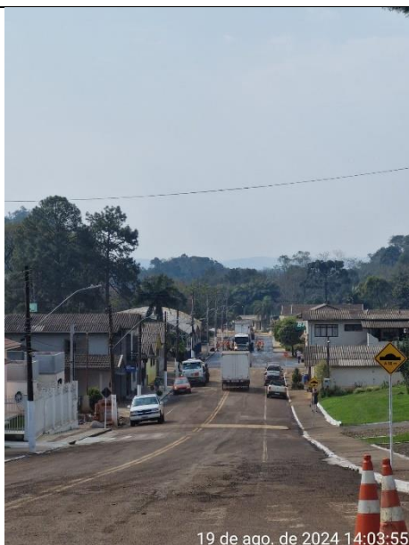
Figura 03 – Rua São Francisco