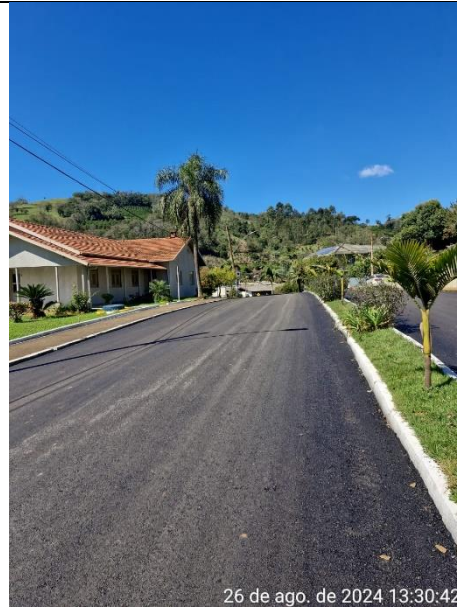
Figura 08 – Rua Miguel Detoni