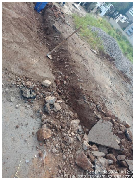
Figura 02 – Execução de Drenos rua Miguel Detoni