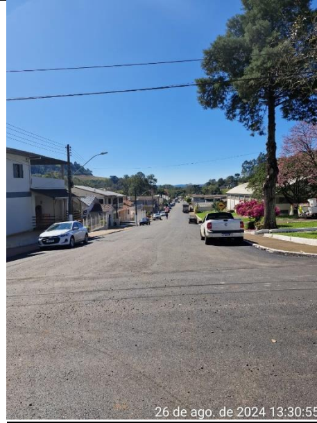
Figura 10 – Rua São Francisco

Mariano Moro – RS, 26 de agosto de 2024.