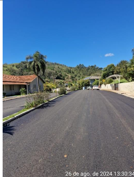
Figura 06 – Rua Miguel Detoni