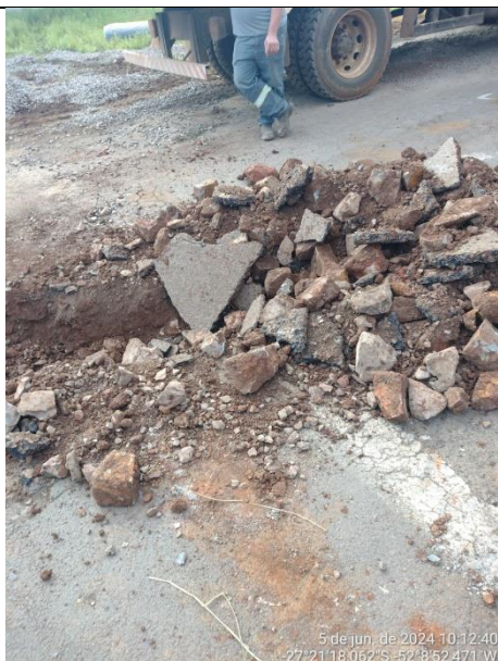
Figura 01 – Execução de Drenos rua Miguel Detoni