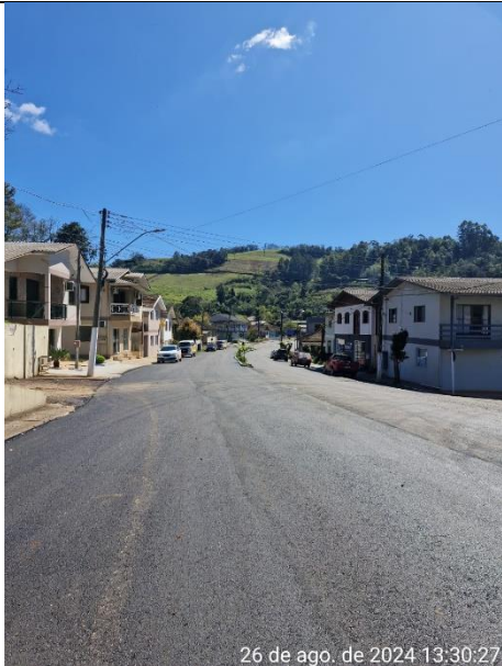
Figura 07 – Rua Miguel Detoni