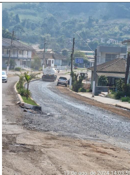
Figura 04 – Rua São Francisco